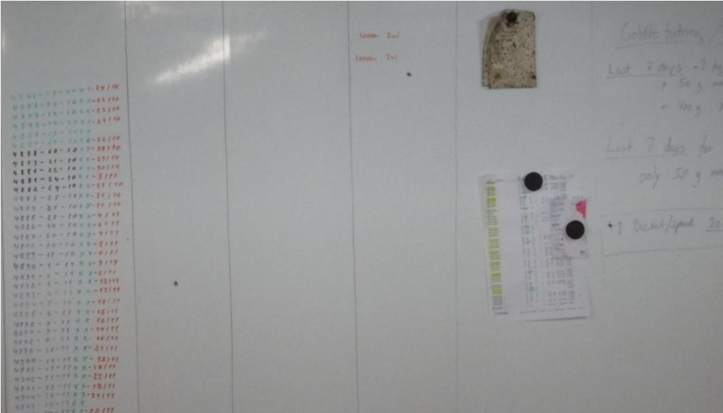
Hinweis- und Informationsschilder

Die Kälberställe sind nummeriert, damit jeder Mitarbeiter genau weiß, wo er zu arbeiten hat, wenn er Anweisungen erhält.