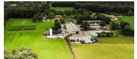
Afbeelding 2: De Marke in Hengelo, Nederland

De naam De Marke model is verbonden aan de onderzoeksboerderij en het agro-innovatiecentrum van Wageningen Universiteit en Research. Dit is een melkveebedrijf op droge zandgrond met 85 melkkoeien op een totale oppervlakte van 55 hectare. De Marke houdt zich vooral bezig met het bevorderen van de acceptatie van het toegepaste onderzoek dat op het bedrijf wordt gedaan. Eén zo'n project, Koeien & Kansen, is een samenwerking binnen een netwerk van 15 toekomstgerichte melkveehouders dat zorgt voor testen, evaluaties en verbeteringen voor de Nederlandse melkveesector. De Marke werkt samen met andere kennisinstellingen en melkveehouders in heel Noord-Europa om innovatieve onderzoeksprojecten te ontwerpen en te testen, met name op het gebied van voeding en management.