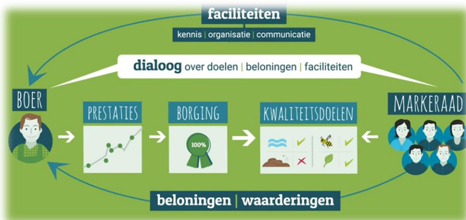
Figuur 1: Het De Marke model verkent en stemt af, ontwikkelt kansen op landelijke en regionale doelen in nauwe samenwerking met verschillende belanghebbenden en betrokken partijen.

Naast het aansturen van het project kan de raad ook andere rollen op zich nemen door boeren te faciliteren met kennis(ontwikkeling), organisatie en communicatie. Figuur 1 geeft een grafische weergave van het model.